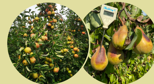
Zonnebrandschade appel albino's en zonnebrand/droogte bij doyenne (2022).

Dirk “Toch voegt de Verenigde Hagel zonnebrand sinds 2022 toe onder de noemer droogte. In 2022 en 2023 hadden vele appelteelers hiervoor een schadetelemoeting. Met eenzelfde eerlijk waardedalingssysteem, zoals bij de hageltaxatie wordt het schadepercentage berekend.”