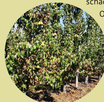
Droogteschade bij peer.

Eddy “Er waren grote verschillen tussen aanplantingen en teeltvoorzieningen die leidden tot grote kwaliteitsverschillen. Hierbij dreigden de goed bewerkte percelen/bedrijven voor een uitkering uit de boot te vallen. Aan de hand van een eerlijk werkend schadeformulier werd met alle teeltfactoren en -maatregelen rekening gehouden opdat een eerlijke schadevergoeding werd uitgekeerd. Ogenscheinlijk goede percelen die die werden aangemeld, genoten zo toch ook van een uitkering.”